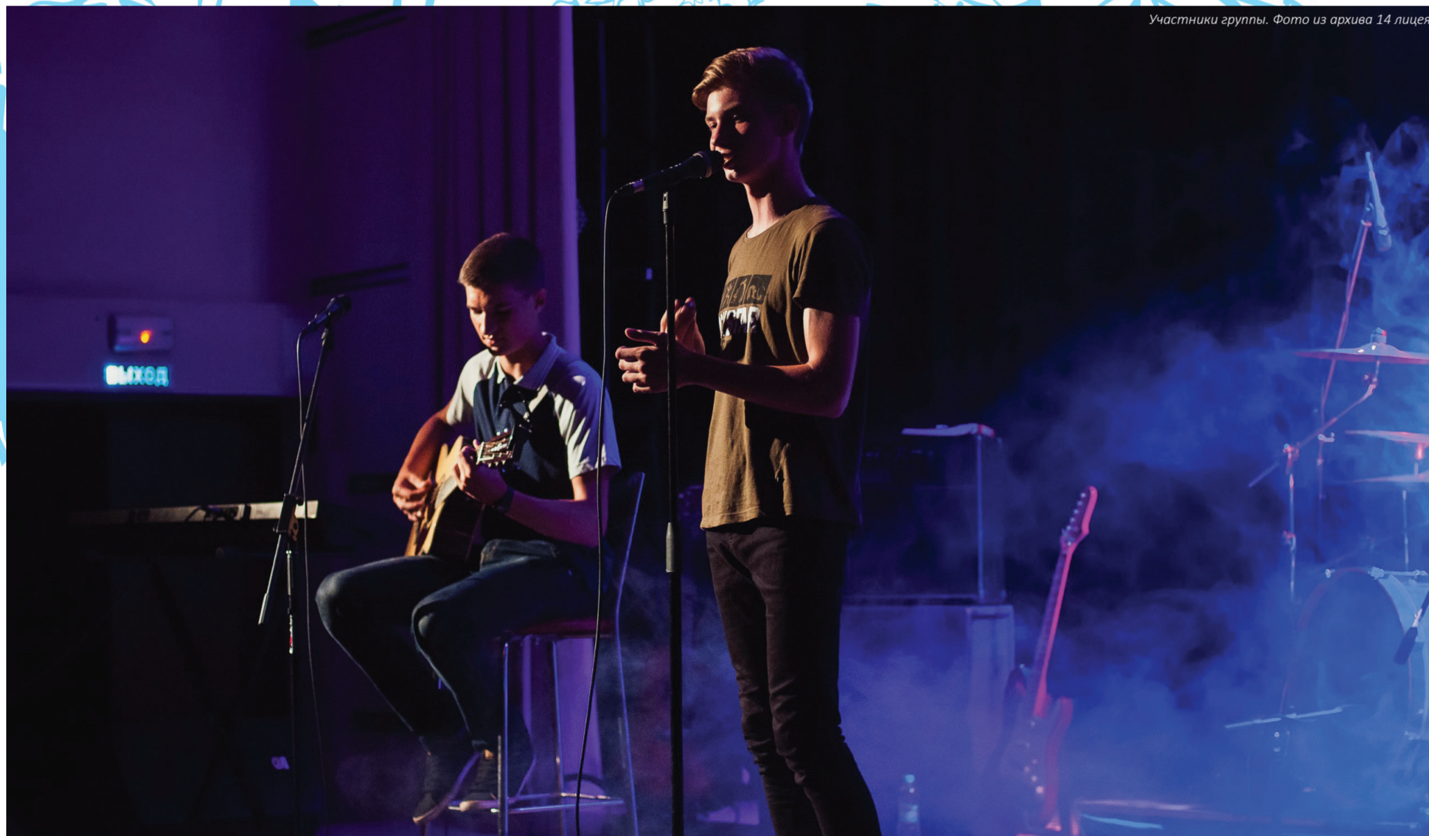
Участники группы.

«JeVie» - именно так называется музыкальный коллектив, созданный выпускником 14 лица Максимом Поповым и нынешним учеником Дмитрием Якимовым. Сейчас группа состоит только из вокалиста и гитариста, однако ребята находятся в поиске бас-гитариста и ударника. Идея создания проекта пришла год назад после