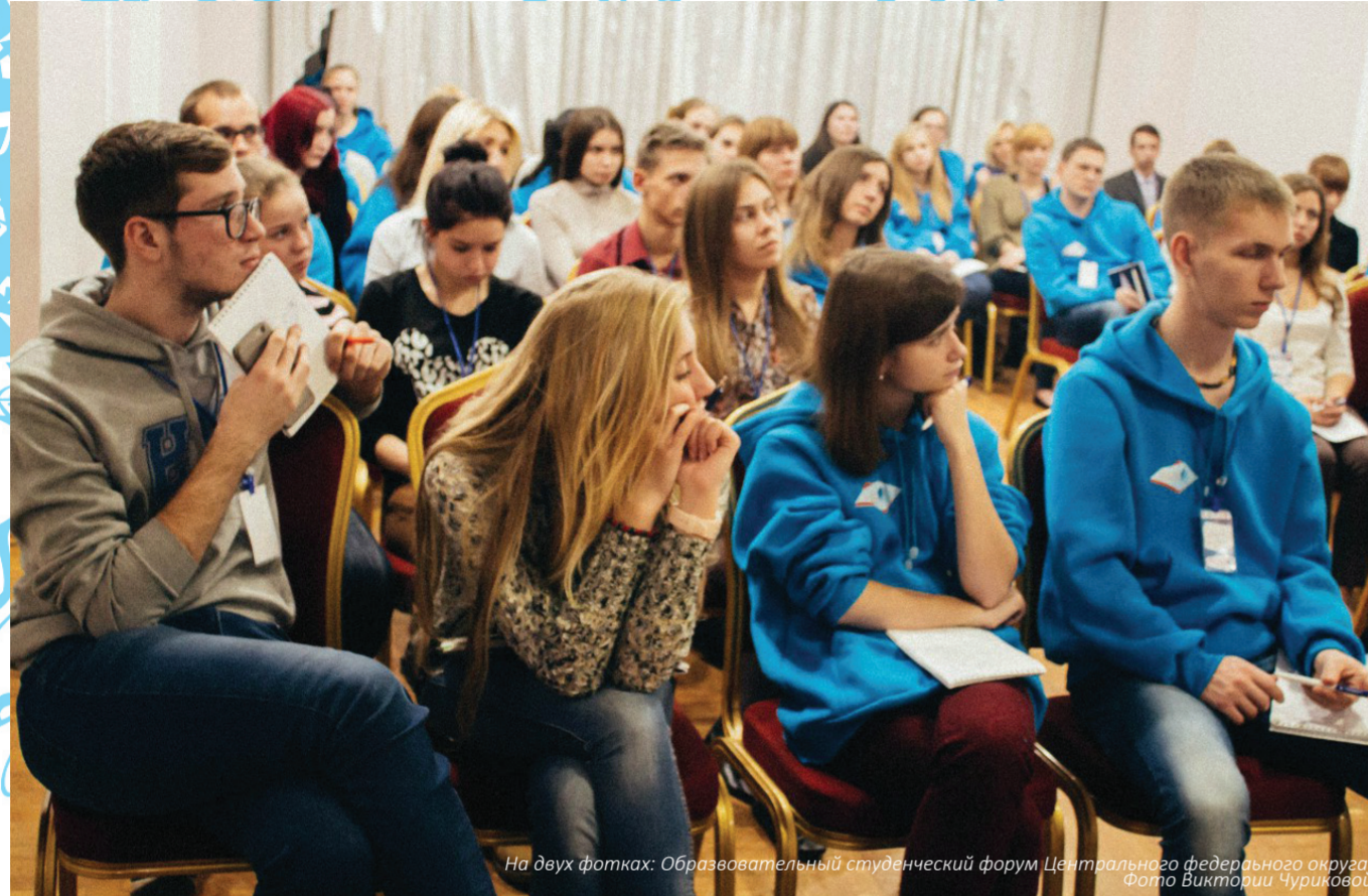
На двух фотках: Образовательный студенческий форум Центрального федерального округа.