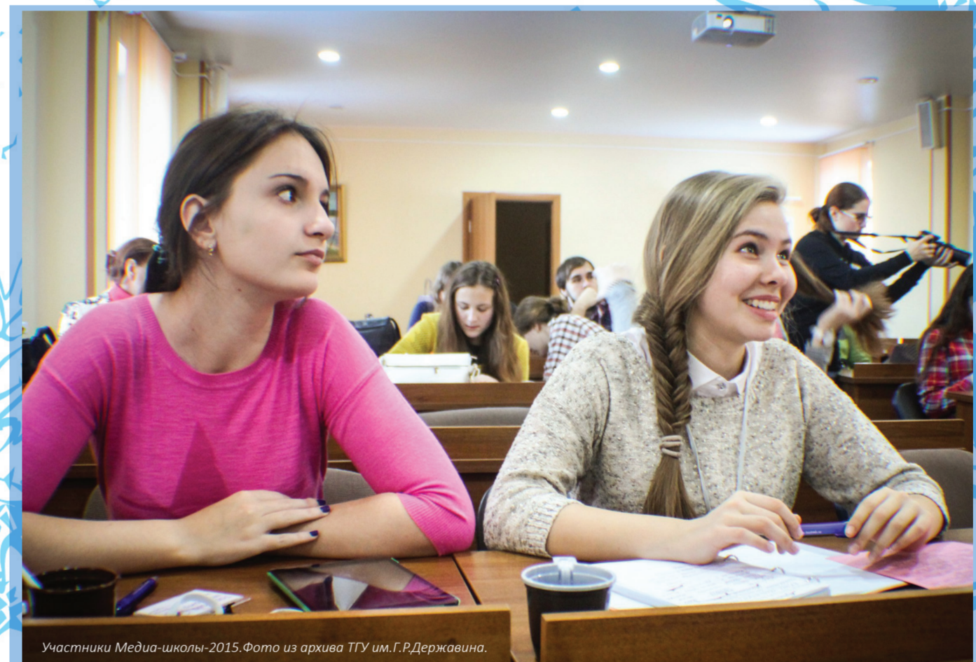
Участники Медиа-школы-2015.