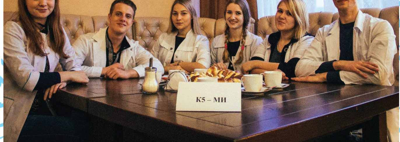
Студенты Медицинского института ТГУ имени Г.Р.Державина.

вали первый раз, отметили хорошую атмосферу, им понравилось, что предусмотрены перерывы, и чаепитие. А наши постоянные участники отметили, что нужно увеличить количество так называемых «челюсок»(девушек, которые забирают ответы и следят за чистотой игры), чтобы все было гладко», - поделилась с нами председатель студенческого совета ТГУ имени Г.Р.Державина Ольга Негрова. Напомним, что известная телевизионная игра «Что? Где? Когда?» вышла в эфир 4 сентября 1975 года и в