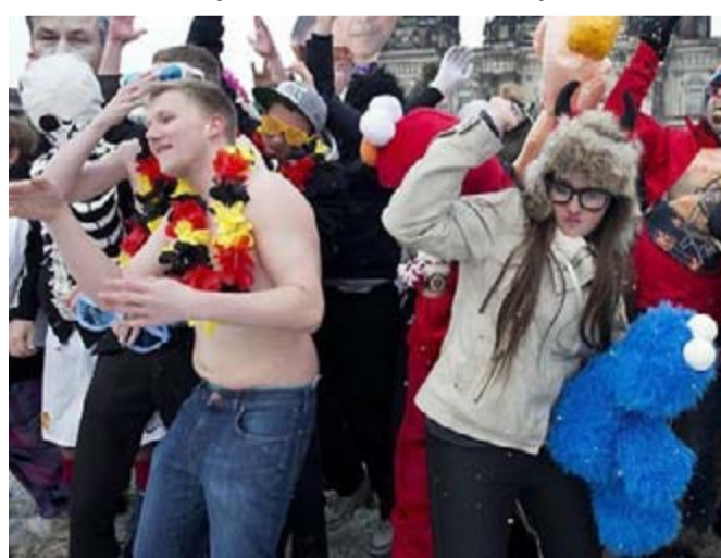
Фото к материалам «Арго им всем» и «Капитальная встряска» с интернет - портала http://www.news.com .