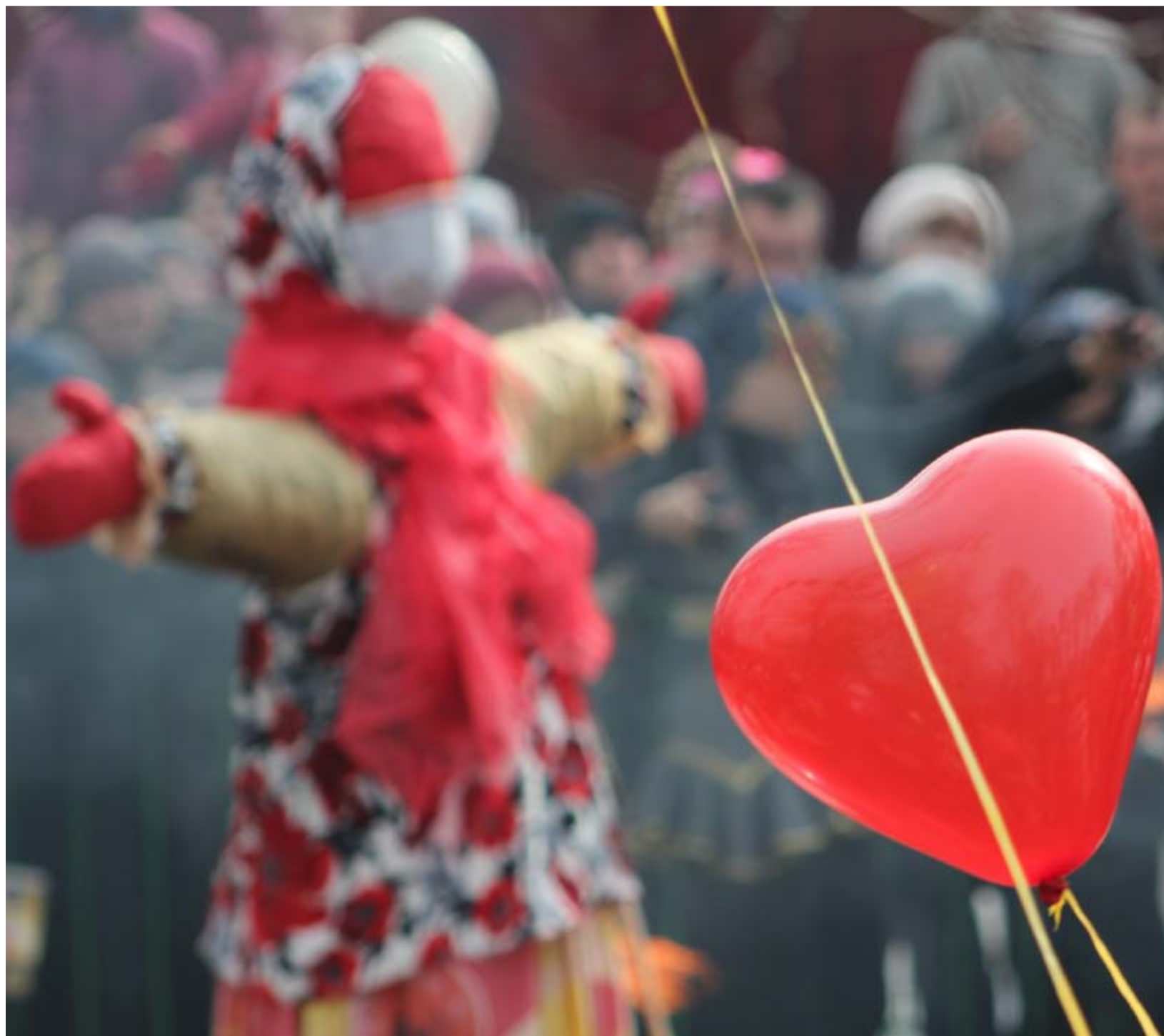
Всю неделю тамбовчане отмечали древний славянский праздник - Масленицу...»