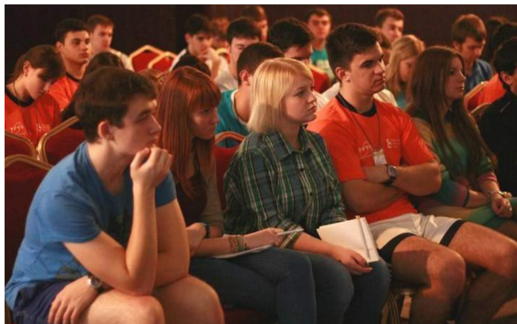
Участники сбора.

«В настоящее время одной из актуальных проблем является подготовка специалистов современных форматов, отвечающих посылам нового времени. Специальностей в университетах, которые нужны будут нашей стране через 5 лет, на сегодняшний день не существует. Это обусловлено постоянно меняющимися форматами и запросами общества. Именно поэтому сейчас большой по-